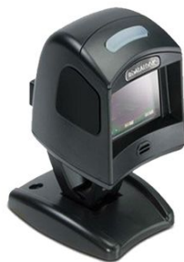
DATALOGIC Scanner Magellan 1100i