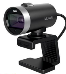
Microsoft LifeCam Cinema