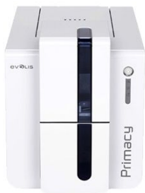
evolis Imprimante Evolis Primacy