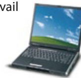
Poste de travail

• Version monoposte Une licence valable pour un seul poste de travail